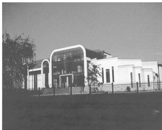
Łódź, Fakultet Teologiczny