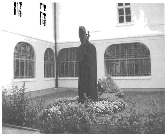
Łakowo, Pomnik Jana Pawła II na dziedzińcu Pałacu Arcybiskupa