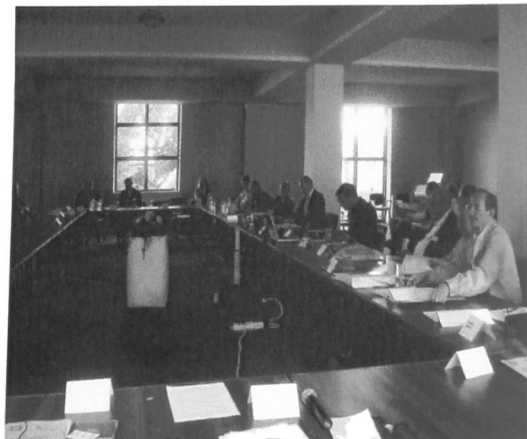
Łakowo, Sala obrad sympozjum