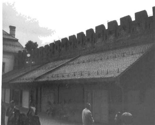
Łódź, Pozostałości po tureckich murach