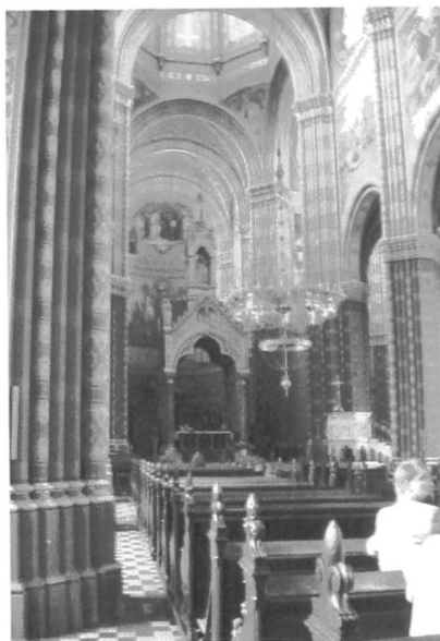
Łakowo, Wnętrze katedry