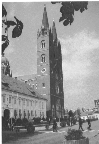
Łódź, Pałac Arcybiskupa oraz Katedra