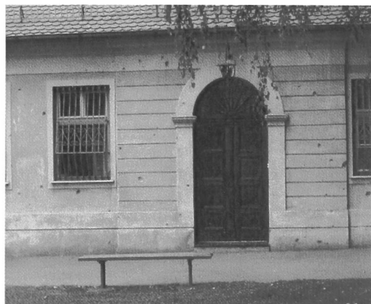
Łódź, Domy Kanoników ze śladami po kulach