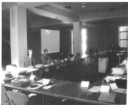
Łakowo, Sala obrad sympozjum