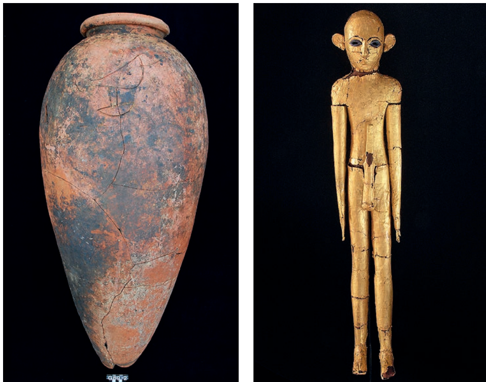
Dzban zasobowy z wyrytym imieniem Iry-Hora. Złota figurka z Komu Wschodniego (wys. 60 cm).

Również na połowę okresu Nagada IIIB datowane jest ukrycie, na Komie Wschodnim, kilkanaście metrów na północ od mastaby, skarbu złożonego z dwóch pokrytych złotą folią figurek (Fig. 5), dwóch krzemienych noży o ceremonialnym charakterze i naszyjnika z paciorków ze skorup strusiego jaja i karneolu 19 . Cechy stylistyczne i typologiczne odkrytych przedmiotów pozwalają na stwierdzenie, że powstały dużo wcześniej zanim zostały ukryte, zapewne jeszcze w okresie Nagada IID lub na początku IIIA 20 . Tak wczesna data może sugerować, że cały depozyt ma związek jeszcze z pierwszą grupą osadników z południa lub został przywieziony przez najeźdźców, którzy ich pokonali i spalili osadę w fazie Nagada IIIA1. Ubogi kontekst archeologiczny odkrycia sugeruje, że wszystkie przedmioty zostały tutaj zdeponowane wtórnie, a miejsce ich odślonięcia nie było tym dla którego zostały stworzone. Jest to zapewne świadectwo ukrycia najcenniejszych przedmiotów przed zbliżającym się najazdem.