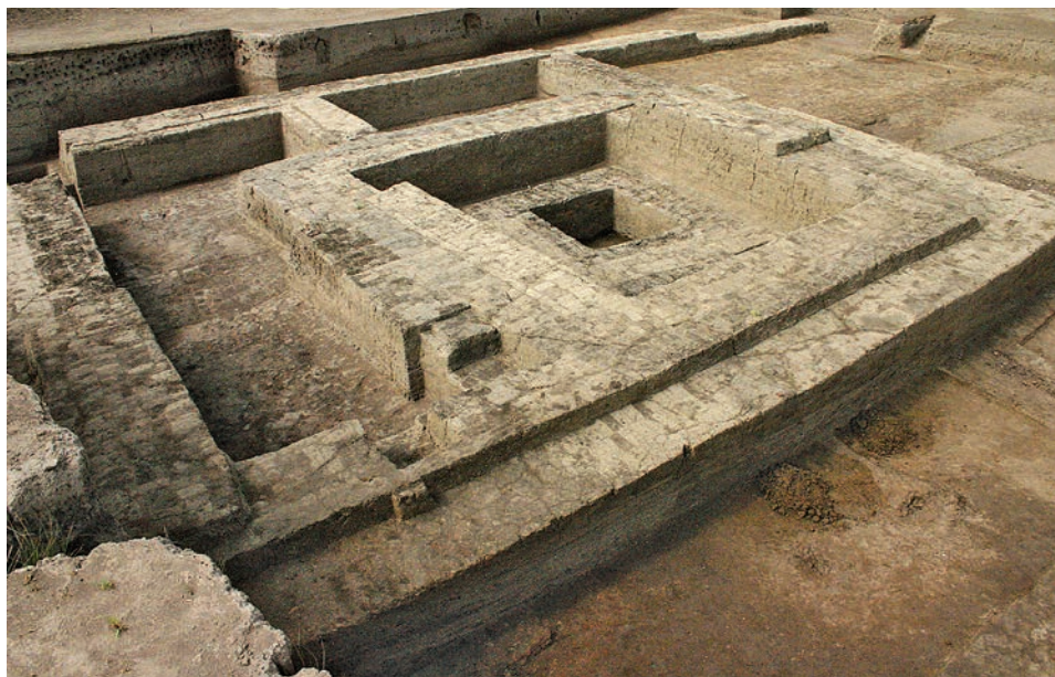
Najstarsza egipska mastaba. Widok od północy.

oddzielające mastabę od reszty osady i wydzielające ubogą osadę działającą na rzecz kultu pośmiertnego właściciela mastaby 18 .