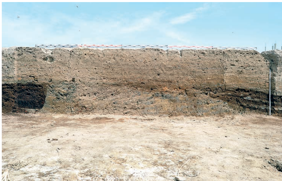
Datowana na okres Nagada IIIA1 warstwa spalenizny na Komie Wschodnim. W środku wcześniejsza, zniszczona budowla.

czasie (Nagada IIIA1) podobny los spotkał całą osadę, a wcześniejsze budowle pokrywa gruba (do 60 cm) spalenizna (Fig. 2). Wszystkie kolejne konstrukcje architektoniczne zostały wzniesione na tej warstwie destrukcji.