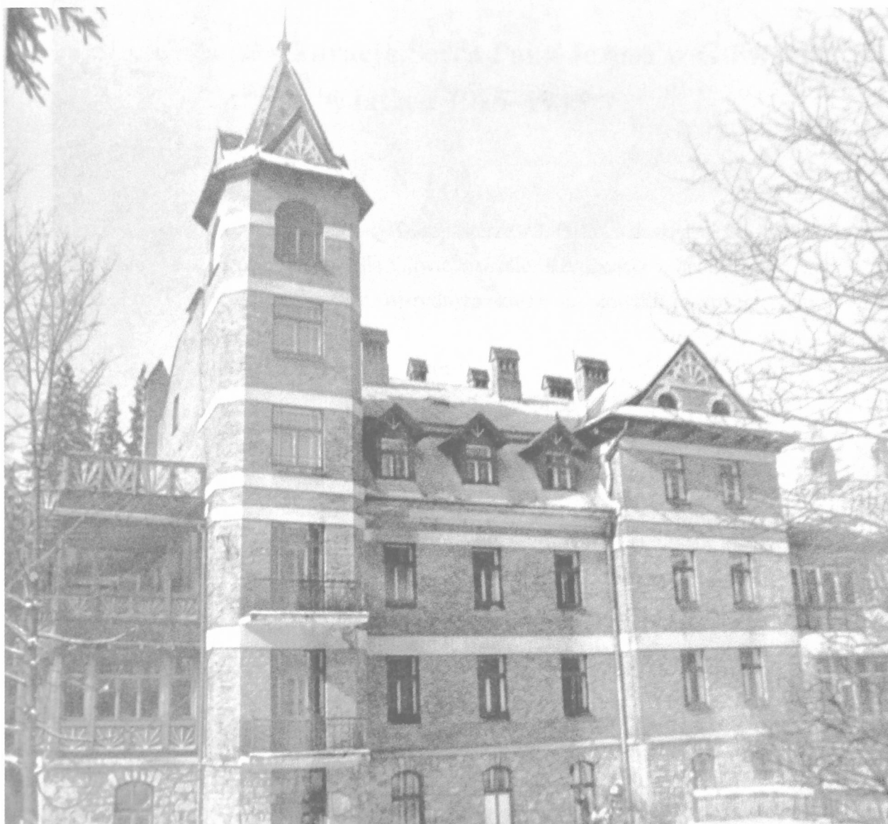
Fot. 1. Księżówka 1914 r.

Keyword: Catholic Church in Poland, Polish Bishop’s Conference, Zakopane, retreat house.