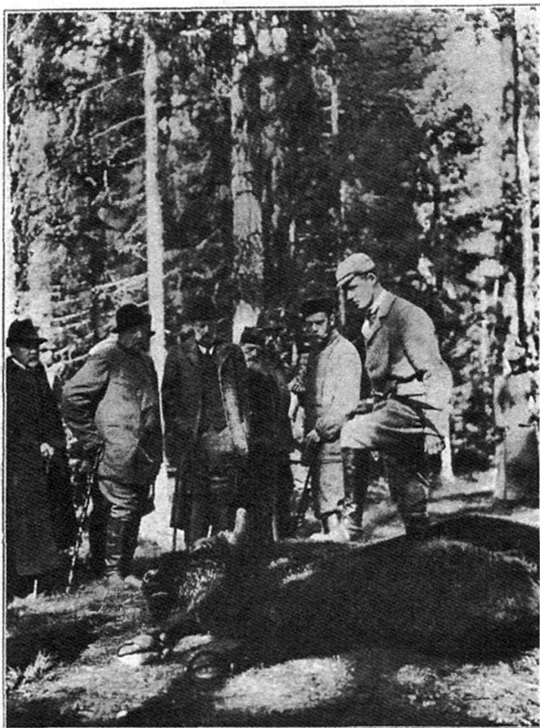
ЕГО ВЕЛИЧЕСТВО ГОСУДАРЬ ИМПЕРАТОРЪ, ГОСУДАРЬ НАСЛѢДНИКЪ МИХАИЛЪ АЛЕКСАНДРОВИЧЪ И ВЕЛИКІЙ КНЯЗЬ ВЛАДИМИРЪ АЛЕКСАНДРОВИЧЪ осматриваютъ убитаго зубра.